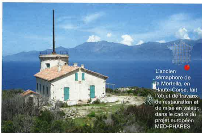
L'ancien sémaphore de la Mortella, en Haute-Corse, fait l'objet de travaux de restauration et de mise en valeur, dans le cadre du projet européen MED-PHARES